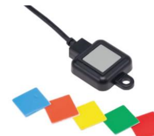
トリガースイッチ