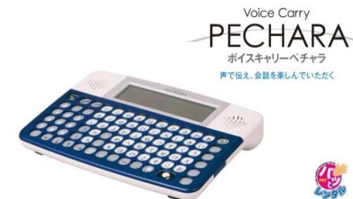
ボイスキャリーペチャラ