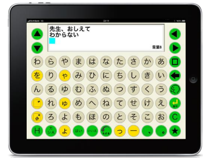
トーキングエイド